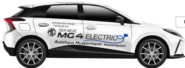
Art. Nr.: MG4-02