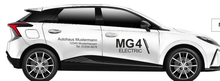
Art. Nr.: MG4-MINI