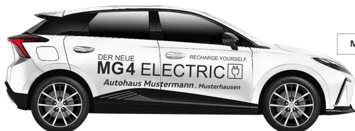
Art. Nr.: MG4-ECO