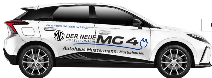
Art. Nr.: MG4-01