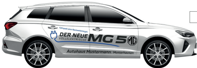
Art. Nr.: MG5-01