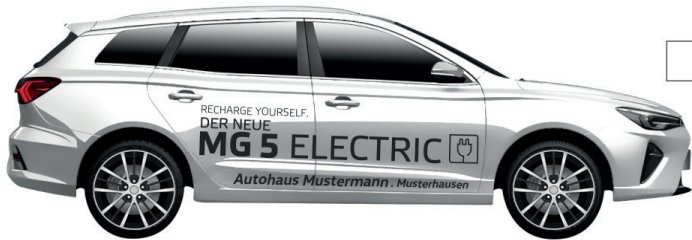
Art. Nr.: MG5-ECO