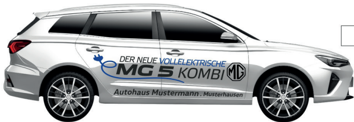
Art. Nr.: MG5-02