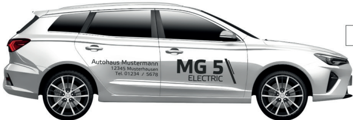
Art. Nr.: MG5-MINI